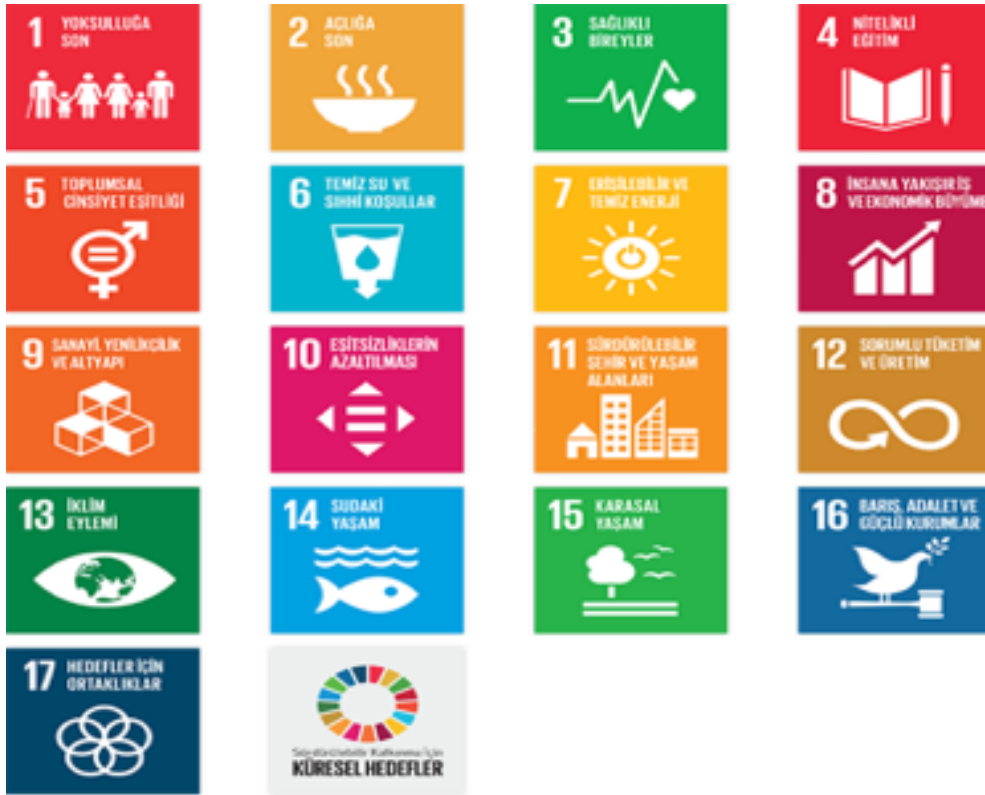
Şekil 1. Birleşmiş Milletler 2030 Sürdürülebilir Kalkınma Hedefleri

Sporun hoşgörüyü, saygıyı, dezavantajlı grupların, kadınların, gençlerin ve toplulukların güçlendirilmesini sağladığı, sağlık, eğitim ve sosyal kapsayıcılık hedeflerinin gerçekleştirilmesini teşvik ettiği barışa ve kalkınmaya artan katkısı tüm çevreler tarafından görülmektedir. Spor bu muazzam potansiyel ile mega spor projelerinden, sokak sporları ve yarışmalarına kadar kalkınma hedeflerine ulaşmada yardımcı olmaktadır (UNOSDP, 2015). Sportif etkinlikler yoluyla, toplumda farkındalık artırılabilir, çevresel olumsuz etkiler en minimize edilebilir, ekonomik kalkınma hedefleri desteklenebilir, eğitimden, sağlığa, cinsiyet eşitsizliğinden, sosyal sınıf ve ırk ayrımlarına ve dezavantajlı gruplara kadar pek çok sosyal alanı içine alan kalkınma sağlanarak ve sürdürülebilir kılınabilir.