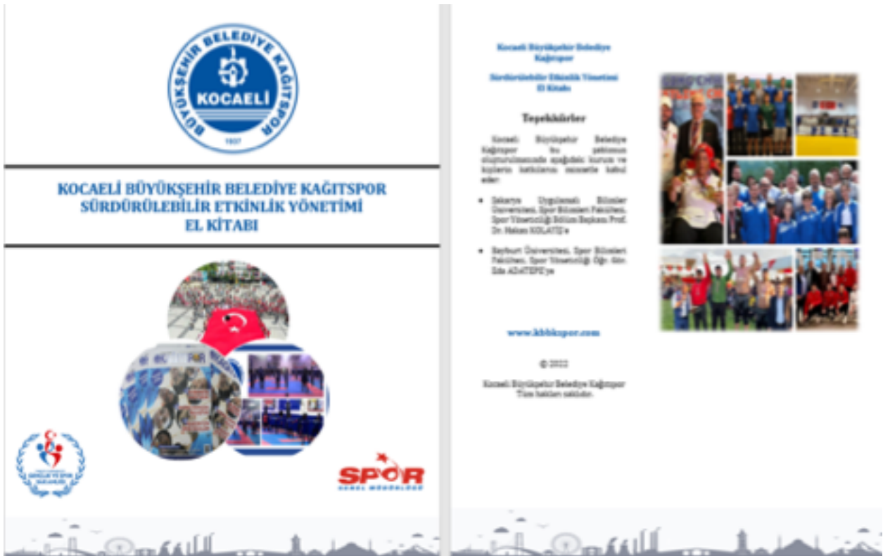
Resim 1. Kapak ve Teşekkürler

Bu çalışmada bir yerel yönetim spor kulübü olan KBB Kağıtspor'da spor yoluyla Birleşmiş Milletler Sürdürülebilir Kalkınma Hedefleri'ni gerçekleştirebilmek için bir el kitabı hazırlanmıştır. Sürdürülebilirlik ve sürdürülebilir etkinlik yönetimi kavramları kapsamında da yol haritası oluşturulmuştur ve mevcut durumun iyileştirilmesi amaç edinilmiştir. Aşağıda Kocaeli Büyükşehir Belediye Kağıtspor Kulübü için hazırlanmış olan el kitabının kısa bir versiyona ait görseller yer almaktadır: